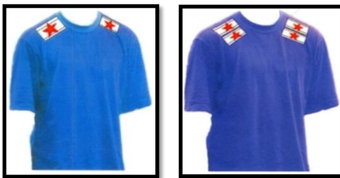
Количество погон у участников